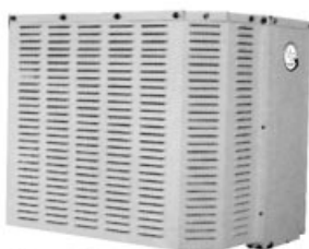
Territoire disponible pour détaillant